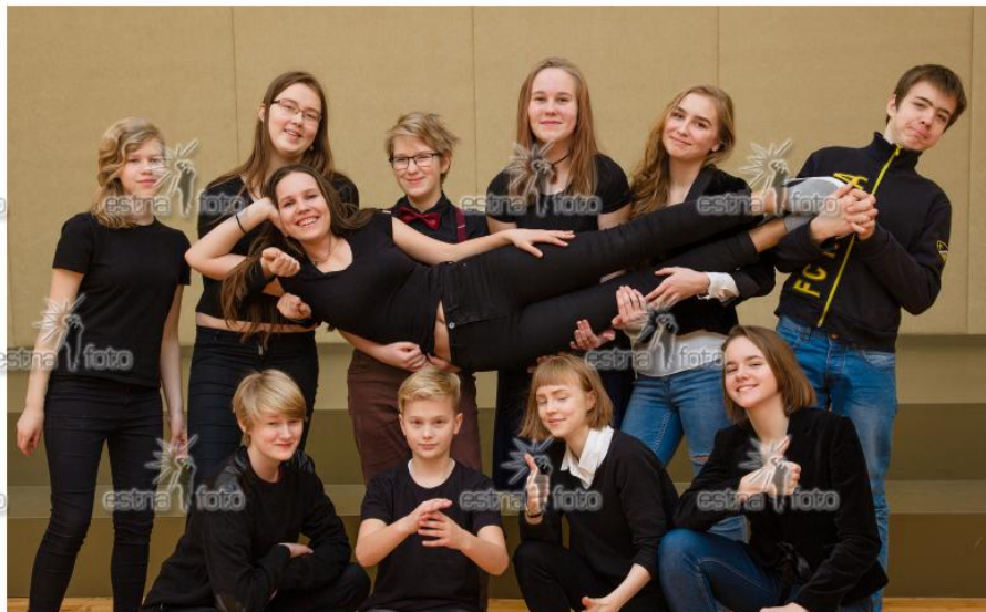
Tartu Kesklinna Kool 2016/2017. õa