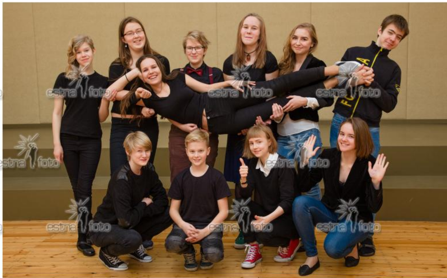
Tartu Kesklinna Kool 2016/2017. õa