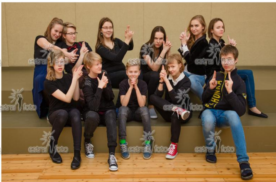
Tartu Kesklinna Kool 2016/2017. õa